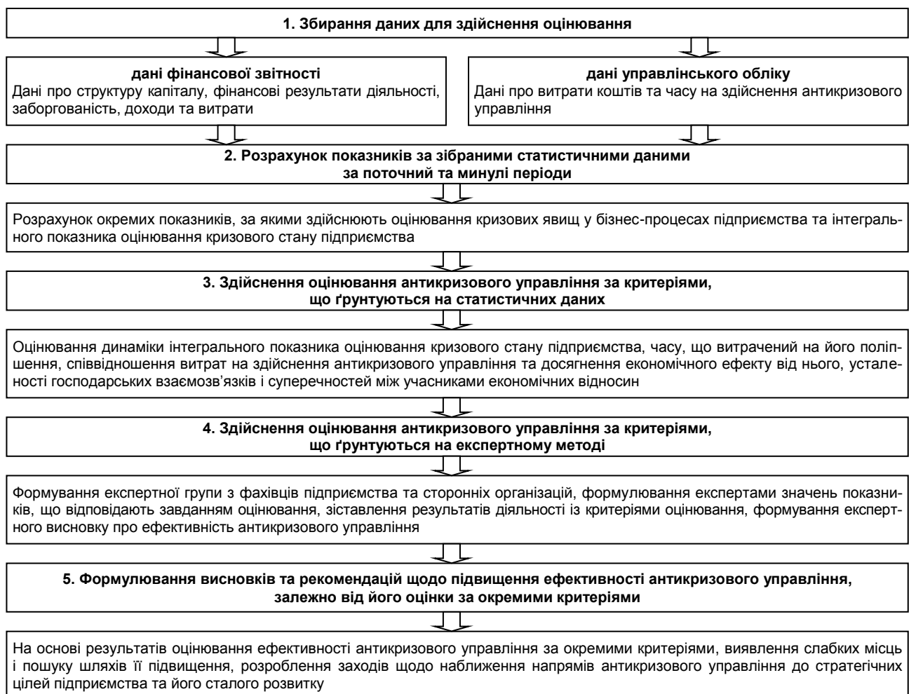
Рис. 2. Порядок здійснення оцінювання ефективності антикризового управління на підприємстві [The procedure for evaluation of the crisis management efficiency]

Можна зробити висновок, що оцінювання ефективності антикризового управління має свої особливості, відповідно до його специфічних рис. У статті розроблено методичний підхід до оцінювання ефективності антикризового управління із застосуванням таких критеріїв, як: динаміка показників оцінювання кризового стану; економічність управління; поліпшення показників діяльності підприємства за одиницю часу; досягнення балансу інтересів; забезпечення життєздатності підприємства; стратегічний характер.