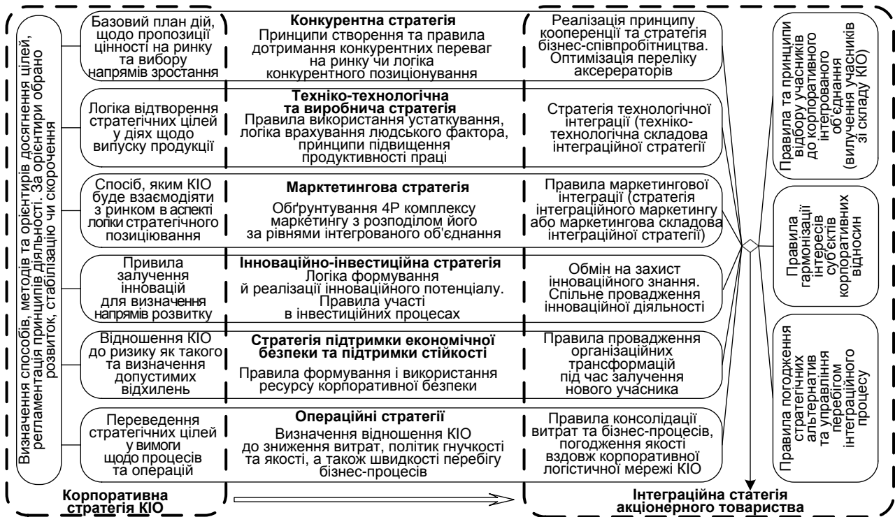
Рис. 2. Логіка формування комплексу інтегративних стратегій корпоративного підприємства [The logic of formation of the complex of corporate enterprise integration strategies]