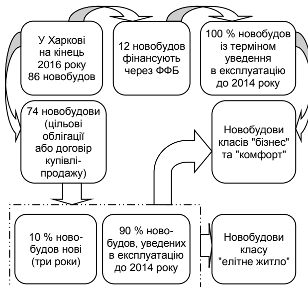
Рис. 2. Підсумки аналізу об'єктів інвестування м. Харкова [The results of the analysis of investment objects in Kharkiv]

Під час вибору житла єдиною інформацією, якою володіє інвестор, є його вартість, естетичні характеристики (клас житла), виконавець будівельних робіт (забудовник) та спосіб фінансування, про що свідчать дані офіційних сайтів забудовників [13; 14]. Спираючись на таку інформацію, інвестор не може оцінити надійність операції, а лише обирає житло за якісним критерієм. Подібна інформація може слугувати лише як вхідна для попереднього етапу визначення об'єкта інвестування. Для здійснення якісного аналізу розглянуто об'єкти сучасного ринку новобудов на прикладі м. Харкова (рис. 2). Зазначено, що для аналізу обрано об'єкти, які є предметом фінансування двох попередньо досліджених фінансових установ міста.