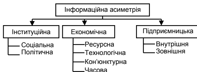
Рис. 1. Класифікація видів інформаційної асиметрії за об'єктами взаємодії [Classification of the information asymmetry types for the objects of interaction]

У суспільстві існує загальна асиметрія на рівні ресурсного забезпечення, соціальної відповідальності, політичної системи, часового виміру (ретроспективного, поточного, перспективного), ринкової кон'юнктури, технологічного розвитку та інформації. На думку автора, саме інформаційній асиметрії відведено головну роль. Зasadною ознакою у процесі розроблення класифікації асиметрії, за якою доцільно визначити роль та місце інформаційної асиметрії в системі бухгалтерського обліку, є об'єкт взаємодії, що показано на рис. 1.