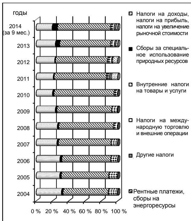
Рис. 1. Структура доходов в Государственный бюджет Украины за период с 2004 по 2014 год [The structure of the revenues to the State Budget of Ukraine for the period from 2004 to 2014]

Для выяснения сложившейся ситуации в данной работе проанализированы объемы экспорта и импорта Украины за период с 1995 по 2013 год. Результаты представлены на рис. 2.