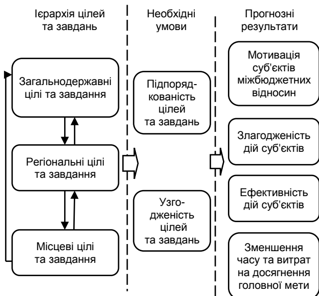
Рис. 2. Узгодженість цільової компоненти методичного підходу до реформування податково-бюджетних відносин

Визначені цілі мають бути підпорядковані загальній меті та бути узгоджені на всіх рівнях міжбюджетних відносин [8]. У разі неузгодженості цілей та завдань регулювання податково-бюджетних відносин вони підлягають перегляду та корегуванню. Основними умовами результативності методичного підходу є узгодженість цілей усіх рівнів міжбюджетних відносин та їх ієрархічна підпорядкованість на всіх рівнях (рис. 2).