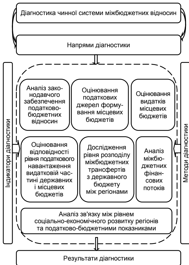
Рис. 3. Складові діагностики чинної системи податково-бюджетних відносин

Наступним блоком методичного підходу є діагностика чинної системи міжбюджетних відносин, що дозволяє простежити їх тенденції в Україні, їх динаміку та результати на конкретний період часу (рис. 3).