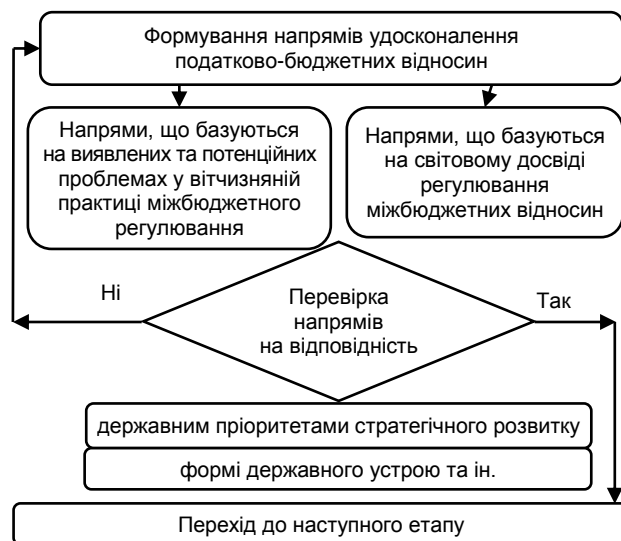
Рис. 5. Особливості вибору напрямів удосконалення податково-бюджетних відносин

Блок забезпечення у методичному підході включає виявлення напрямів удосконалення міжбюджетних відносин з урахуванням вітчизняного та світового досвіду регулювання міжбюджетних відносин (рис. 5).