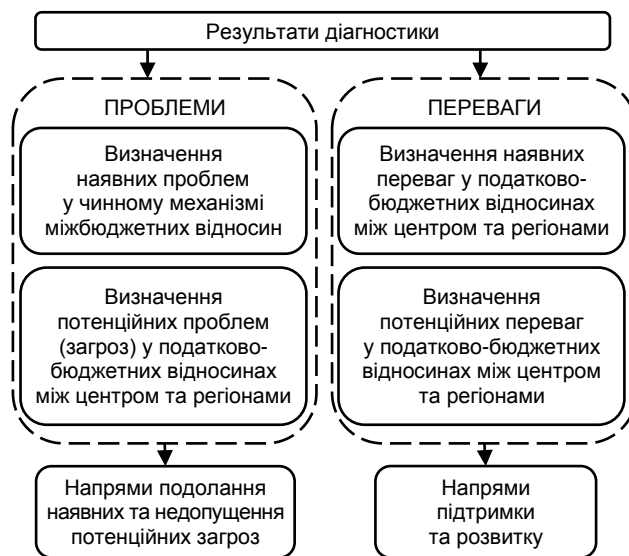
Рис. 4. Проблеми та переваги чинної системи міжбюджетних відносин

Окрім наявних проблем у податково-бюджетних відносинах слід враховувати й потенційні загрози, що можуть бути сформовані під впливом різноманітних факторів та впливати з недосконалої системи законодавчого, організаційного та іншого забезпечення міжбюджетних відносин (рис. 4).