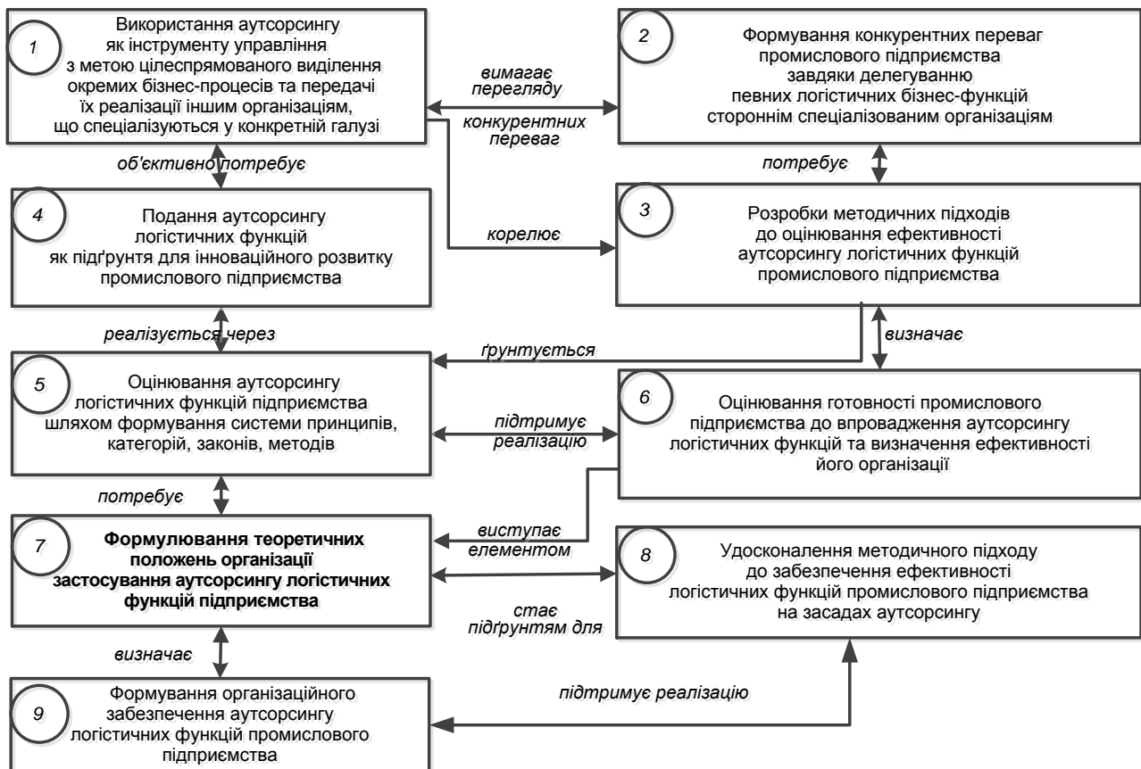
Рис. 2. Логіка процесу забезпечення ефективності аутсорсингу логістичних функцій промислового підприємства

Наведена на рис. 2 логіка процесу забезпечення ефективності аутсорсингу логістичних функцій демонструє місце, роль і необхідність розробки теоретичних положень організації аутсорсингу логістичних функцій промислового підприємства, що виступатимуть підґрунтям для формування відповідного організаційного та методичного забезпечення.