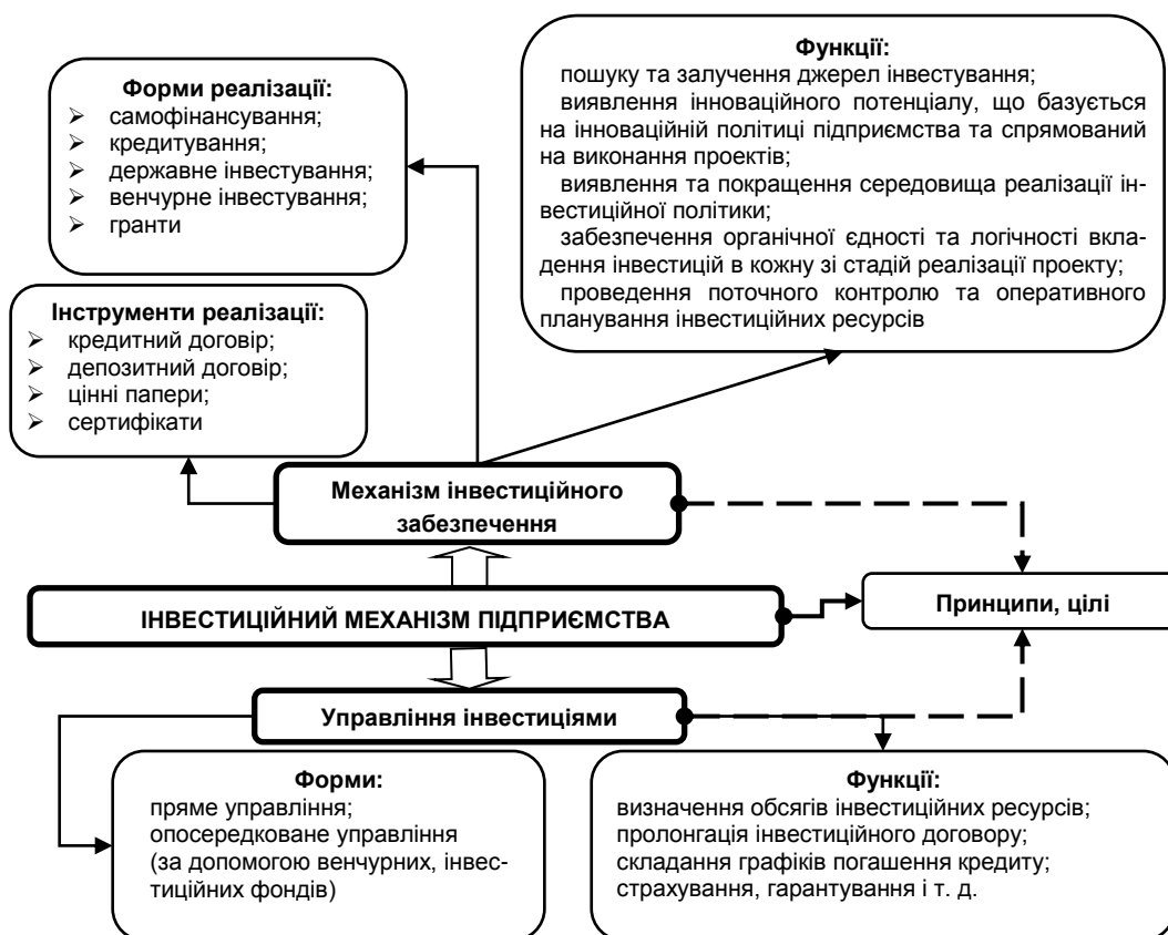
Рис. 2. Компонентна структура інвестиційного механізму підприємства (складено авторами)

До основних детермінант інвестиційного забезпечення інноваційного розвитку підприємств електроенергетики відносять: