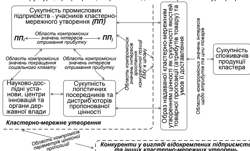
Рис. 1. Підхід до подання кластерно-мережних утворень як середовища гармонізації інтересів їх учасників та стейкхолдерів

Дійсно, будь-яка економічна система може розглядатися в термінах категорії "інтерес". На жаль, наявні розробки [11; 12] оперують цієї категорією на рівні дуальної взаємодії виробника та споживача. Для досягнення мети дослідження автор пропонує розглядати КМУ в цілому як середовище гармонізації інтересів його учасників. Авторський варіант такого розуміння кластера наведено на рис. 1. Особливістю пропозиції є виділення зон гармонізації інтересів на підґрунті залучення набутків дисципліни рефлексивного управління. Тут передбачено як узгодження інтересів сторін, так і узгодження усвідомлень щодо параметрів пропонованої цінності та атрибутів товарів у взаємних уявленнях споживача й виробника в рамках виділених на рис. 1 контурів рефлексивного управління.