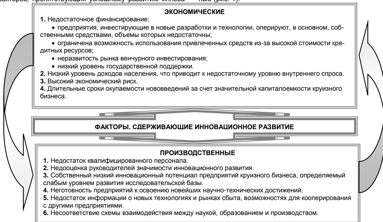
Рис. 1. Основные факторы, препятствующие инновационному развитию предприятий круизного бизнеса

Факторы, сдерживающие осуществление инноваций в круизной индустрии, можно условно разделить на две основные группы – экономические и производственные (рис. 1).