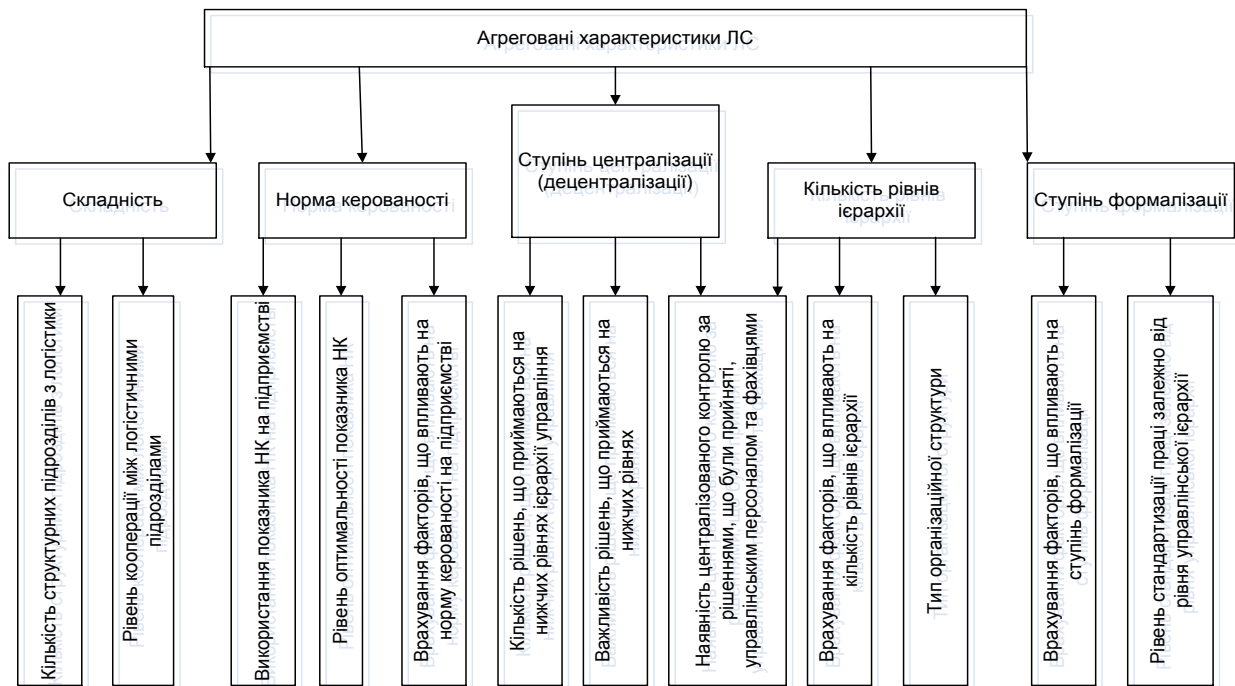
Рис. 2. Агреговані характеристики ЛС та чинники, що їх визначають