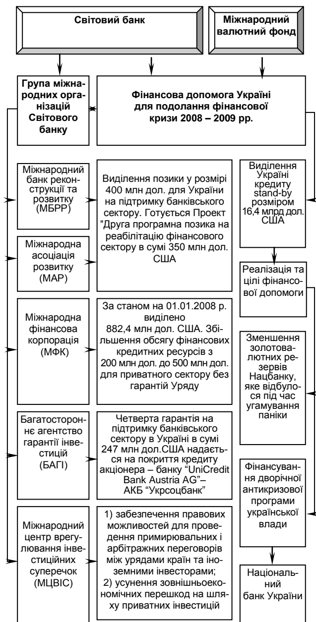
Рис. 1. Фінансова допомога Україні, надана Світовим банком та Міжнародним валютним фондом у 2008 – 2009 роках для подолання глобальної фінансової кризи [5; 16 – 18]

Участь у фінансовій допомозі Україні міжнародних фінансових організацій, таких, як Світовий банк та Міжнародний валютний фонд, для подолання фінансової кризи 2008 – 2009 років наведена на рис. 1.