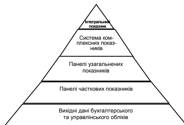
Рис. 1. Піраміда структуризації показників

Увесь процес одержання комплексного показника називається оцінюванням, а результат процесу – оцінкою. Для формування загальносистемного критерію ефективності, який потрібен для координації та загальної оптимізації господарської діяльності, здійснюється згортання комплексних показників в один інтегральний. Операція консолідації складається з вибору типу згортання, вибору моделі комплексного показника та визначення коефіцієнтів значимості часткових показників.