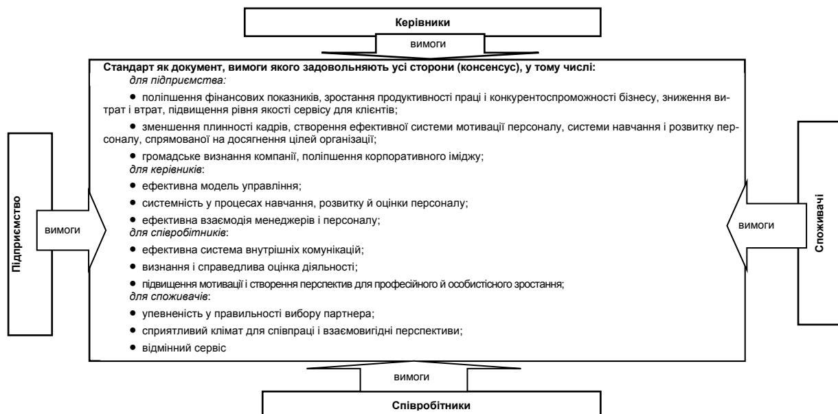
Рис. 1. Комплекс взаємних переваг зацікавлених сторін стандартизації процесу розвитку кадрового потенціалу підприємства (розроблено автором за роботами [1; 3; 6; 9 –12])

Потреба у стандартизації як діяльності виникає в разі необхідності оптимального упорядкування вимог, котрі формуються у процесі розвитку кадрового потенціалу торговельного підприємства між підприємством, керівниками, співробітниками, клієнтами під впливом таких чинників, як науково-технічний прогрес, безпека, захист прав споживачів, глобалізація ринку, міжнародне співробітництво, набутий досвід тощо (рис. 1). Соціально відповідальна поведінка підприємств торгівлі передбачає дотримання спектра прав споживачів, а також низки прав власників майна та персоналу. Можливість реалізації цих прав має бути заздалегідь закладена у процес розвитку кадрового потенціалу підприємства через розробку і впровадження стандартів цього процесу.