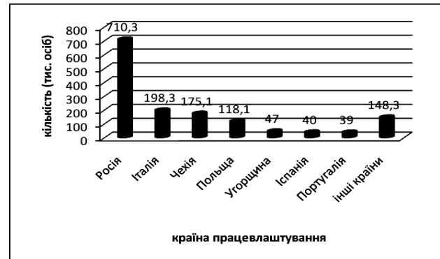
Рис. 2. Обсяги зовнішньої трудової міграції українців протягом 2005 – 2008 рр. [11]

2008 рр., підтверджують наявність двох основних векторів зовнішньої трудової міграції українців: до Росії та до країн ЄС, зокрема Італії, Іспанії, Польщі, Чехії, Португалії та Угорщини (рис. 2) [11]. Як видно, протягом цього періоду інтенсивність міграції до Греції знизилася, натомість міграція до РФ різко зросла.