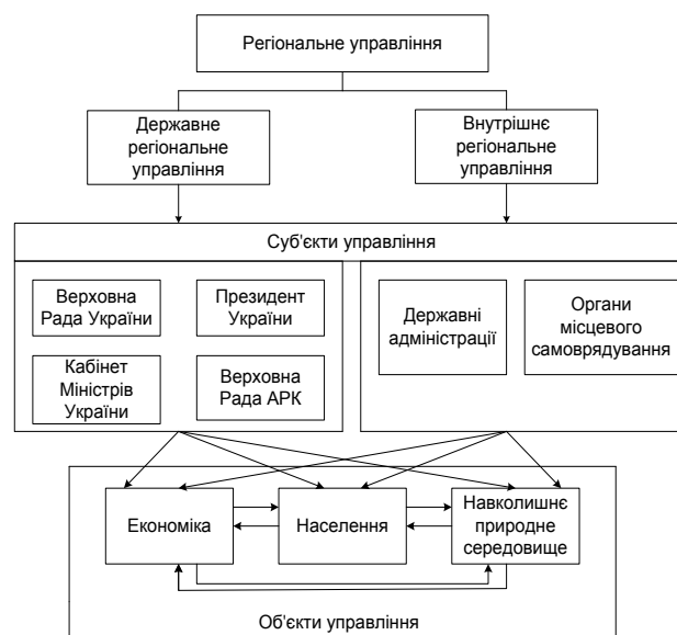
Рис. 1. Структура регіонального управління

Вирішення частини цих проблем можна досягти на регіональному рівні, однак деякі вимагають державного втручання, відповідно до чого доцільно вирізняти державне регіональне управління, що проводиться державними органами влади, і внутрішнє управління регіонів, що здійснюється органами регіональної влади та місцевого самоврядування. Ці два види регіонального управління є взаємодоповнюючими (рис. 1).