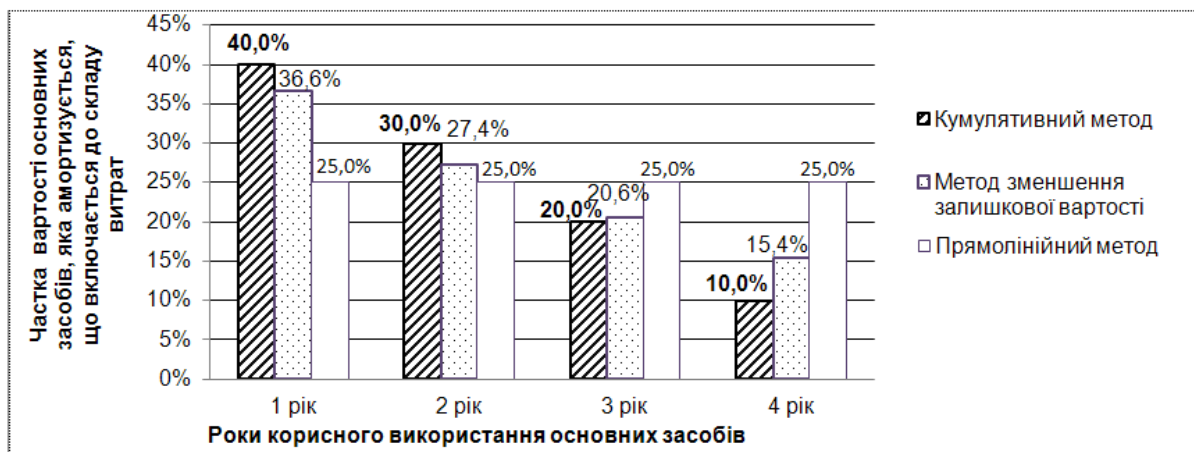
Рис. 2. Порівняльний аналіз темпів амортизації основних засобів зі строком корисного використання 4 роки при різних методах її нарахування

Згідно з п. 146.1 ст. 146 Податкового кодексу облік вартості, яка амортизується, ведеться за кожним об'єктом, що входить до складу окремої групи основних засобів, на відміну від Закону № 334/94-ВР, п. 8.3.5 якого встановлювалося, що "облік балансової вартості основних фондів, які підпадають під визначення груп 2, 3 і 4, ведеться за сукупною балансовою вартістю відповідної групи основних фондів".