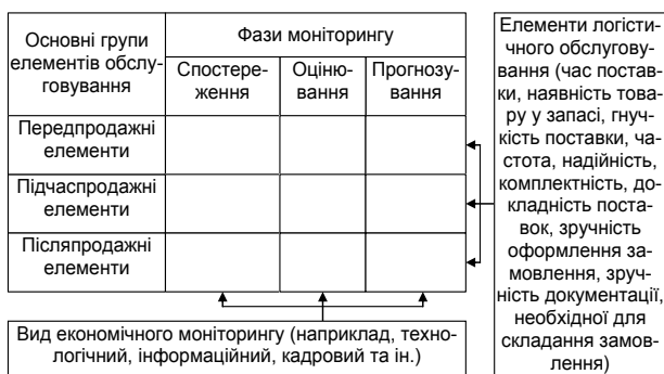
Рис. 3. Принципова схема підходу до формування груп методів економічного моніторингу логістичної системи (з урахуванням роботи [9, с. 12, 26])

Застосування запропонованого підходу дасть можливість більш системно розподілити існуючі методи, які використовуються в контролінгу, діагностиці та іншому і які можуть бути застосовані для рішення задач моніторингу логістичних систем. У зв'язку з тим, що методи спостереження в системах економічного моніторингу не представлені в літературі, слід визначити напрями їх формування. За основу можна прийняти методи збору інформації, що використовуються в маркетингу. Узагальнюючи, можна умовно назвати більшу частину методів маркетингових досліджень методами моніторингу. Для пояснення наведемо такі цитати [10, с. 33]: "Маркетингові дослідження (marketing research) – це систематичне і об'єктивне виявлення, збір, аналіз і використання інформації для підвищення ефективності ідентифікації і рішення маркетингових проблем (можливостей)", "задача маркетингових досліджень – представлення точної, об'єктивної інформації, яка відображає справжній стан справ". Користуючись інформацією [10, с. 247–249], представимо класифікацію методів спостереження, які можна після відповідного обґрунтування і опису використовувати в системах економічного моніторингу логістичних систем (рис. 4).