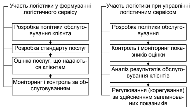
Рис. 2. Схема впливу логістики на логістичний сервіс (на основі роботи [8, с. 363–365])

Визначившись з основними групами методів моніторингу, далі слід зосередитися на реалізації методів економічного моніторингу в логістичних системах. На рис. 2 наведено сучасне представлення місця моніторингу з позиції логістики при формуванні й управлінні логістичним сервісом.