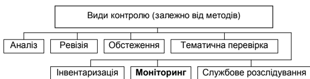
Рис. 1. Класифікація видів контролю (на основі роботи [6, с. 120–121])

Розгляд і визначення методів моніторингу потребує встановлення груп методів, до яких вони належать. Вдалою систематизацією методів можна вважати класифікацію, що наведена в [6, с. 120–121]. Згідно з даною класифікацією моніторинг відноситься до одного з видів контролю за класифікаційною ознакою "залежно від методів" (рис. 1).